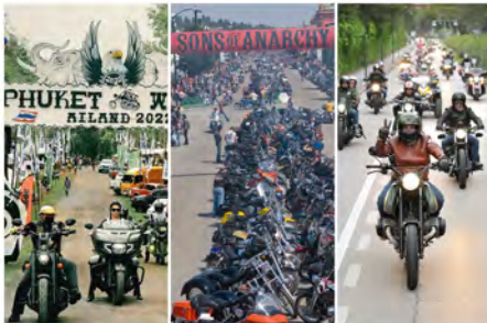
DOSSIER EVENTI: I TOP 10 AL MONDO