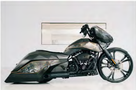
H-D STREET GLIDE HINTSTEINER GROUP