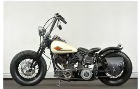
H-D SHOVEL 1340 VINTAGE H-D MOTORCYCLES