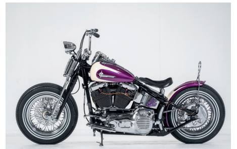
H-D SOFTAIL FAT BOY RCK'N'ROLL CHOP