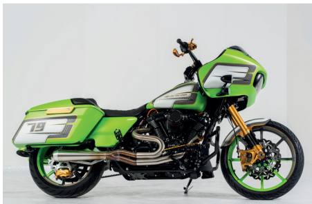
H-D ROAD GLIDE GALLERY MOTORCYCLES