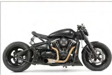
KAWASAKI VN2000 BIKER SHERIF