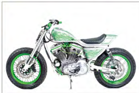
SPORTSTER XLH 883 RD KUSTOM & DESIGN