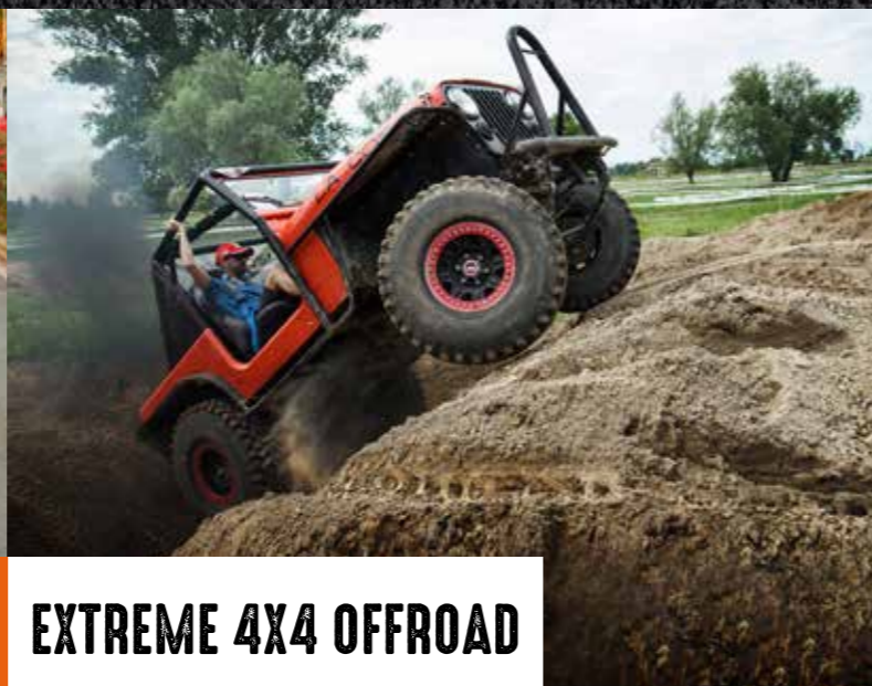
EXTREME 4X4 OFFROAD