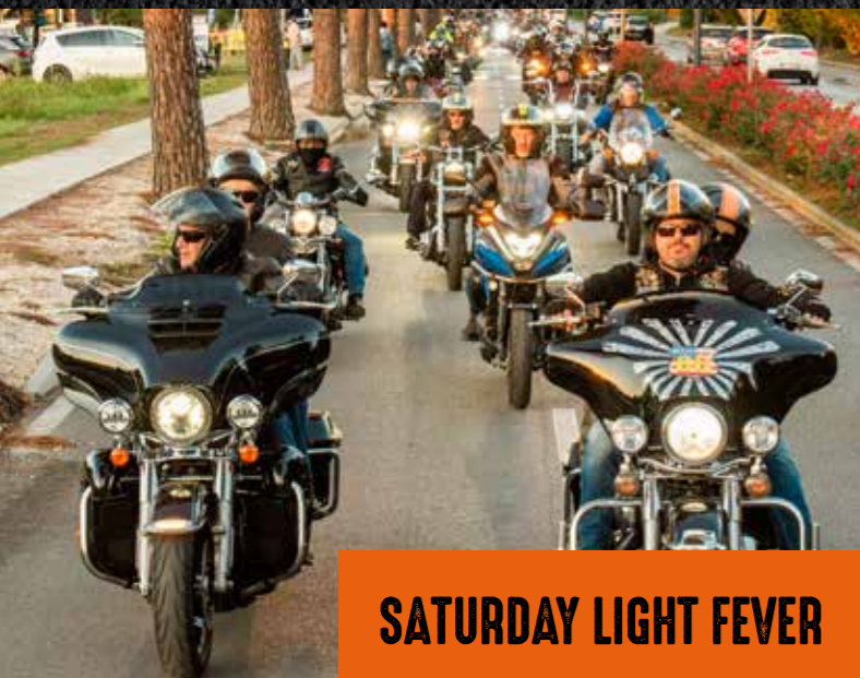
SATURDAY LIGHT FEVER